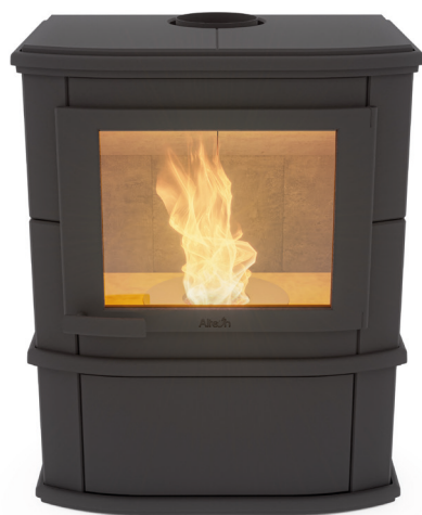
Grande Nobles Pellet